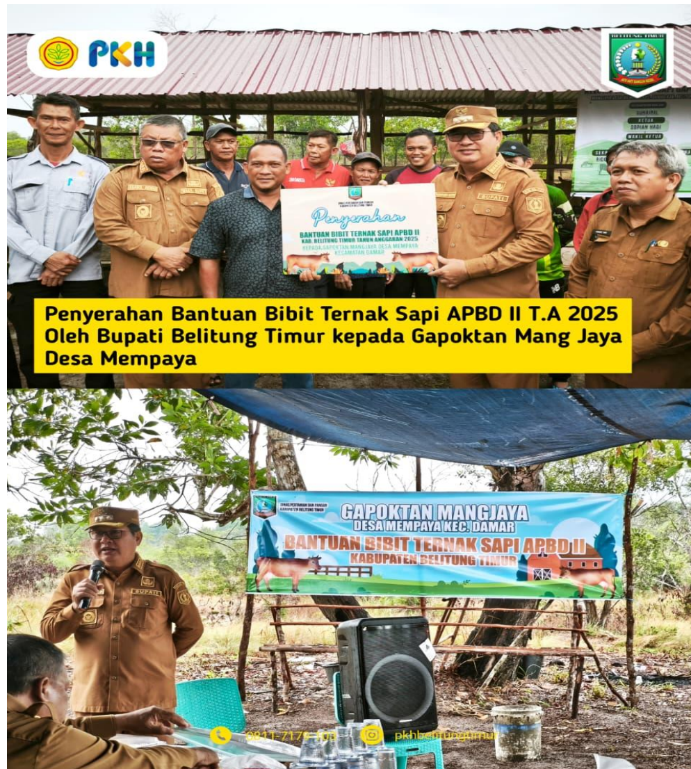
Gambar 8. Pelaksanaan kegiatan Penyerahan Bantuan Ternak Sapi APBD II Kabupaten Belitung Timur Tahun 2025 kepada Gapoktan Mangjaya Desa Mempaya Kabupaten Belitung Timur