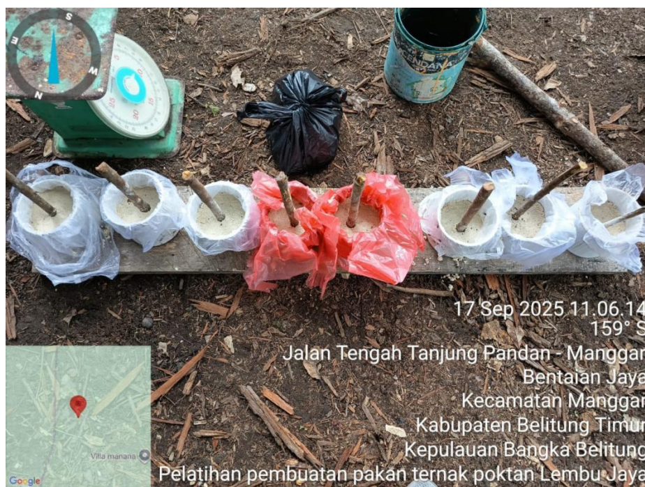
Gambar 14. Kegiatan Workshop dan Bimbingan Teknis Kelompok Ternak Penerima Bantuan Ternak Sapi Tahun 2025

Dinas pertanian dan pangan juga menyelenggarakan pelatihan budidaya puyuh bagi peternak untuk meningkatkan kompetensi, mencakup pemeliharaan, manajemen pakan, pencegahan penyakit, hingga aspek ekonomi usaha. Pelatihan ini bertujuan untuk membekali peternak dengan keterampilan teknis dan manajerial agar dapat mengembangkan usaha puyuh secara optimal.