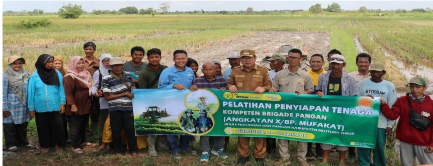
Gambar 2 (Kegiatan Pembinaan Petani Tanaman Jagung Komposit/Pipil)