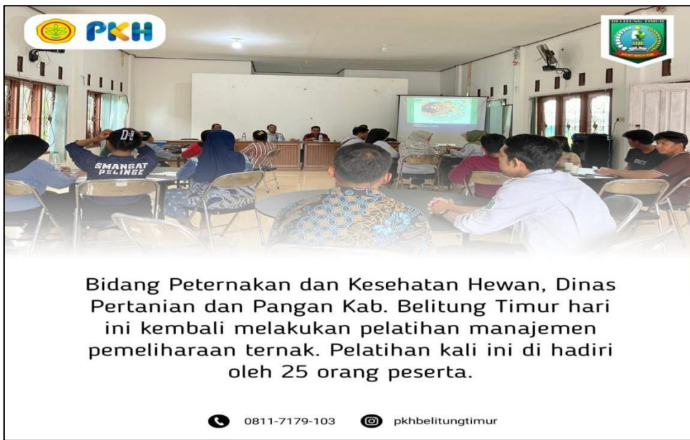
Gambar 15. Kegiatan Pelatihan Manajemen Budidaya Ternak Puyuh Di Desa Limbungan Kecamatan Gantung Kab. Belitung Timur

Tidak kalah penting dilaksanakan juga kegiatan pembinaan dan pelatihan kepada para Juru Sembelih Hewan (Juleha) di Kabupaten Belitung Timur. Kegiatan ini terus dioptimalkan agar pelaksanaan pemotongan ternak sesuai dengan aturan dan tatacara penyembelihan hewan yang halal dan sesuai dengan syariat Islam.