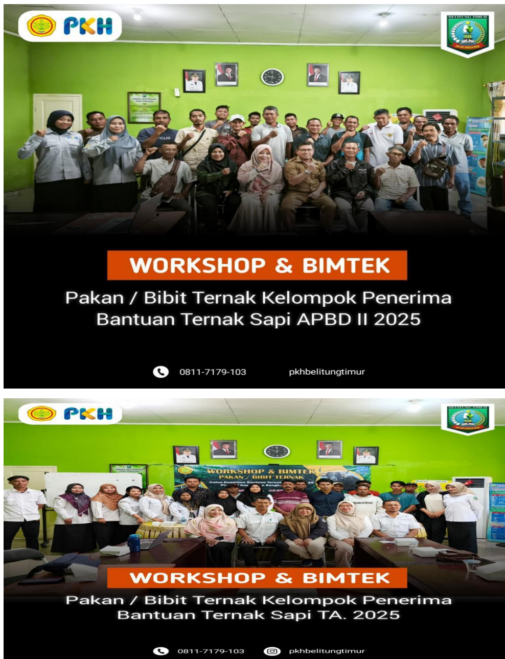
Gambar 13. Kegiatan Workshop dan Bimbingan Teknis Kelompok Ternak Penerima Bantuan Ternak Sapi Tahun 2025

Selain kegiatan Workshop dan Bimbingan Teknis, Dinas Pertanian dan Pangan Bidang Peternakan dan Kesehatan Hewan Kabupaten Belitung Timur menyelenggarakan pelatihan pengolahan pakan ternak dalam rangka meningkatkan pengetahuan dan keterampilan anggota kelompok tani dalam pengolahan pakan. Pembuatan pakan silase dan mineral blok diharapkan dapat meningkatkan produktivitas ternak serta efisiensi penggunaan sumber daya pakan.