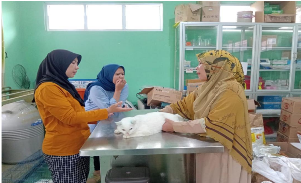
Gambar 2. Pelaksanaan Kegiatan Pelayanan Kesehatan Hewan di Ruang Pengobatan Dinas Pertanian Dan Pangan Kab.Belitung Timur