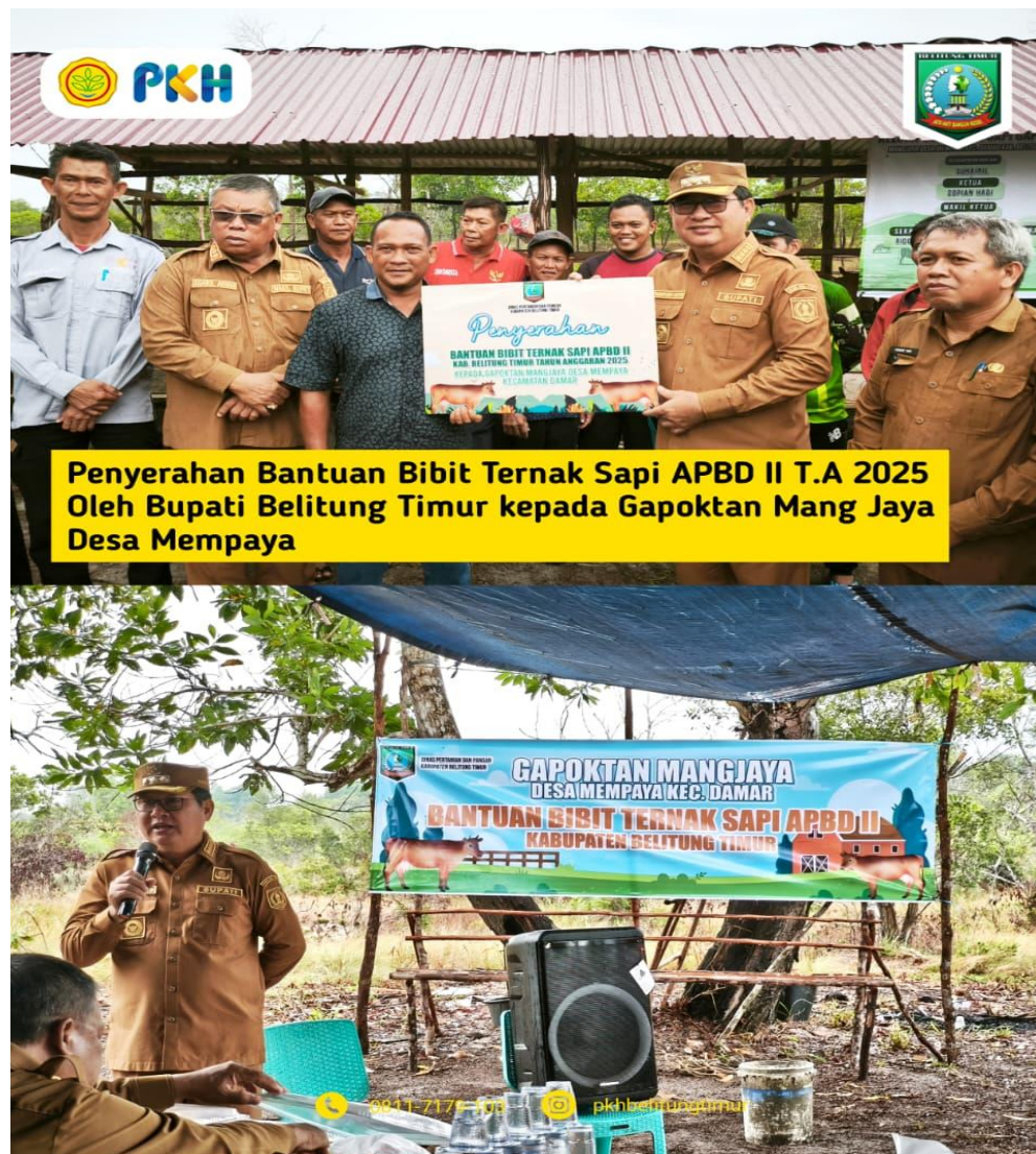
Gambar 8. Pelaksanaan kegiatan Penyerahan Bantuan Ternak Sapi APBD II Kabupaten Belitung Timur Tahun 2025 kepada Gapoktan Mangjaya Desa Mempaya Kabupaten Belitung Timur