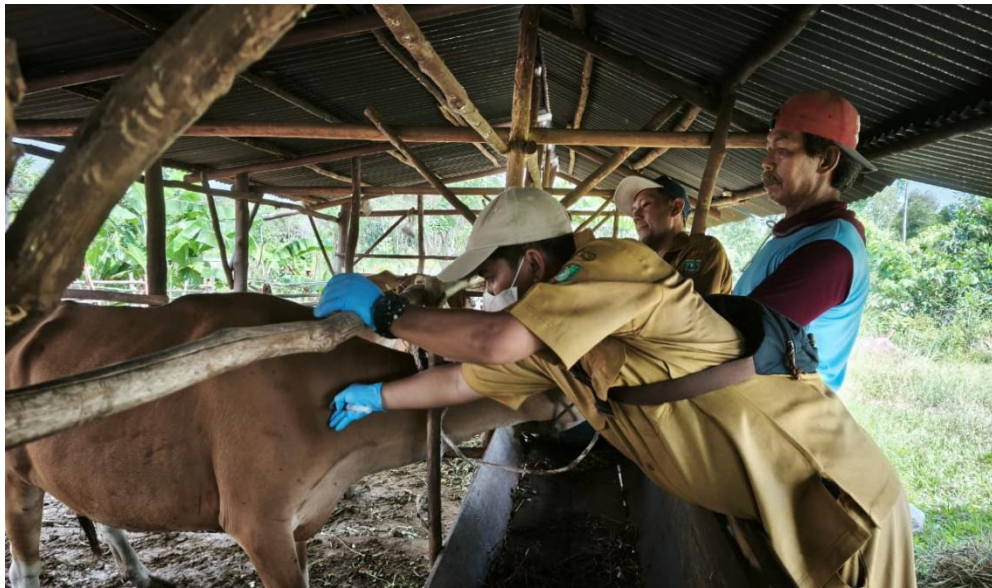
Gambar 1. Pelaksanaan Kegiatan Vaksinasi Penyakit Mulut dan Kuku (PMK) Tahun 2025 di Kabupaten Belitung Timur

Selain tindakan vaksinasi penyakit mulut dan kuku (PMK), dilaksanakan juga kegiatan pelayanan kesehatan hewan di pusat kesehatan hewan (puskesmas) Desa Padang Kecamatan Manggar, dengan jumlah pelayanan kesehatan hewan dari Januari s.d Desember tahun 2025 adalah sebanyak 436 ekor, jumlah kegiatan pelayanan kesehatan hewan dan pengobatan dilapangan dari Januari s.d Desember tahun 2025 sebanyak 1.497 ekor, dan pelayanan perkawinan ternak melalui kawin suntik inseminasi buatan (IB) serta pemeriksaan kebuntingan (PKB) dari Januari s.d Desember Tahun 2025 sebanyak 137 ekor serta juga dilaksanakan kegiatan pengambilan serum darah ternak dengan tujuan untuk mengidentifikasi terhadap suatu penyakit yang dapat membahayakan ternak maupun masyarakat sekitar.