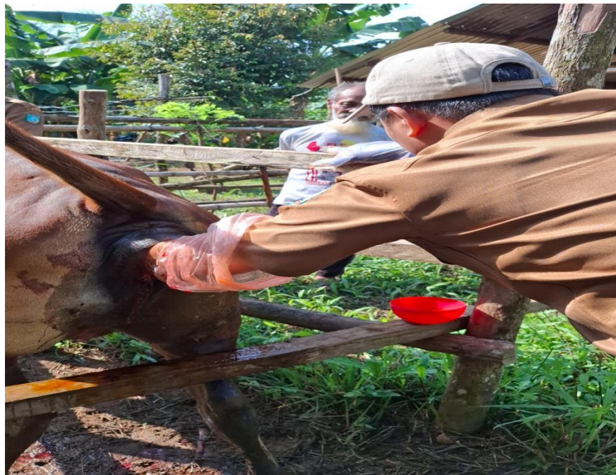
Gambar 7. Pelaksanaan kegiatan pemeriksaan kebuntingan (PKB) pada kelompok ternak sapi di Kabupaten Belitung Timur

Untuk mengoptimalkan pemenuhan kebutuhan daging konsumsi masyarakat di Kabupaten Belitung Timur, Dinas Pertanian dan Pangan juga terus memaksimalkan strategi peningkatan produksi hewan ternak. diantaranya dengan memberikan bantuan ternak Sapi sebanyak 12 ekor (1 ekor Jantan dan 11 ekor Betina) kepada Gabungan Kelompok Ternak Mangjaya Desa Mempaya Kecamatan Damar Kabupaten Belitung Timur yang diketuai oleh Sopian Hadi dengan jumlah anggotanya sekitar 10 orang.