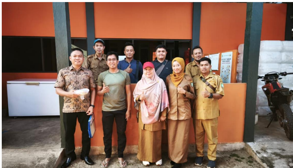
Gambar 10. Pelaksanaan kegiatan Audit Nomor Kontrol Veteriner oleh Tim Auditor Prov. Kep. Bangka Belitung Kepada Di Unit Usaha Pengolahan Madu CV. Raja Trigona Belitung di Desa Baru Kecamatan Manggar Kabupaten Belitung Timur. Nomor Kontrol Veteriner (NKV) adalah sertifikat resmi pemerintah yang membuktikan bahwa unit usaha produk hewan (seperti daging, susu, telur, dan olahannya) telah memenuhi standar higiene, sanitasi, dan keamanan pangan sehingga produknya aman dikonsumsi, utuh, dan layak diperjualbelikan, serta meningkatkan daya saing produk. Dinas Pertanian dan Pangan Kabupaten Belitung Timur terus mendorong pelaku usaha pangan asal