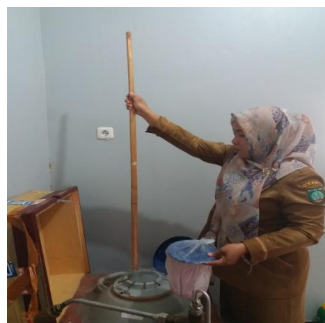
Gambar 5. Kegiatan penyediaan Sarana Prasarana Nitrogen Cair ( N_2 Cair) program Inseminasi Buatan di Dinas Pertanian dan Pangan Kab. Belitung Timur

Inseminasi buatan pada sapi (IB) atau kawin suntik adalah teknik reproduksi yang melibatkan pemasukan semen (sperma) dari sapi jantan unggul ke dalam saluran