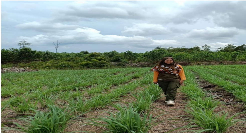
Gambar 12. Kegiatan peningkatan penyediaan hijauan pakan ternak yang berkualitas oleh kelompok ternak di Kabupaten Belitung Timur

Penguatan kelembagaan dan pemberdayaan peternak bertujuan untuk meningkatkan kesejahteraan peternak dengan cara memperkuat organisasi kelompok peternak melalui berbagai pelatihan, pendampingan, dan pengembangan kemitraan. Tujuannya adalah untuk memperjuangkan kepentingan bersama peternak secara kolektif, mulai dari aspek teknis budidaya hingga pemasaran yang adil dan berkelanjutan, sehingga mereka dapat memiliki daya tawar yang lebih kuat dan minim risiko usaha.