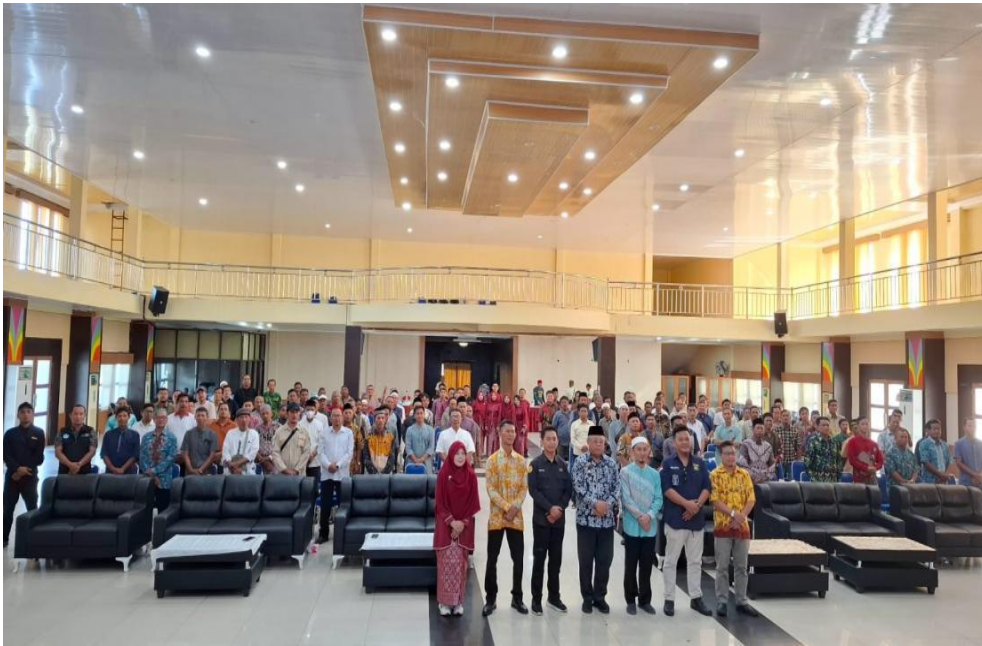
Gambar 16. Pelaksanaan Kegiatan Pelatihan Juru Sembelih Halal (Juleha) di Kabupaten Belitung Timur