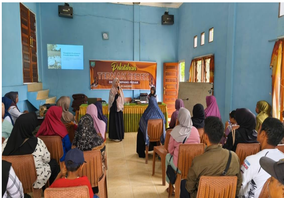
Gambar 17. Pelaksanaan Kegiatan Pelatihan Budidaya Ternak Bebek Pada Kelompok Ternak Di Kabupaten Belitung Timur

Berdasarkan Sumber Badan Pusat Statistik, Hasil Sensus Pertanian, Kabupaten Belitung Timur merupakan salah satu Kabupaten di Provinsi Kepulauan Bangka Belitung yang populasinya meningkat, hal ini memberikan pengaruh yang signifikan terhadap