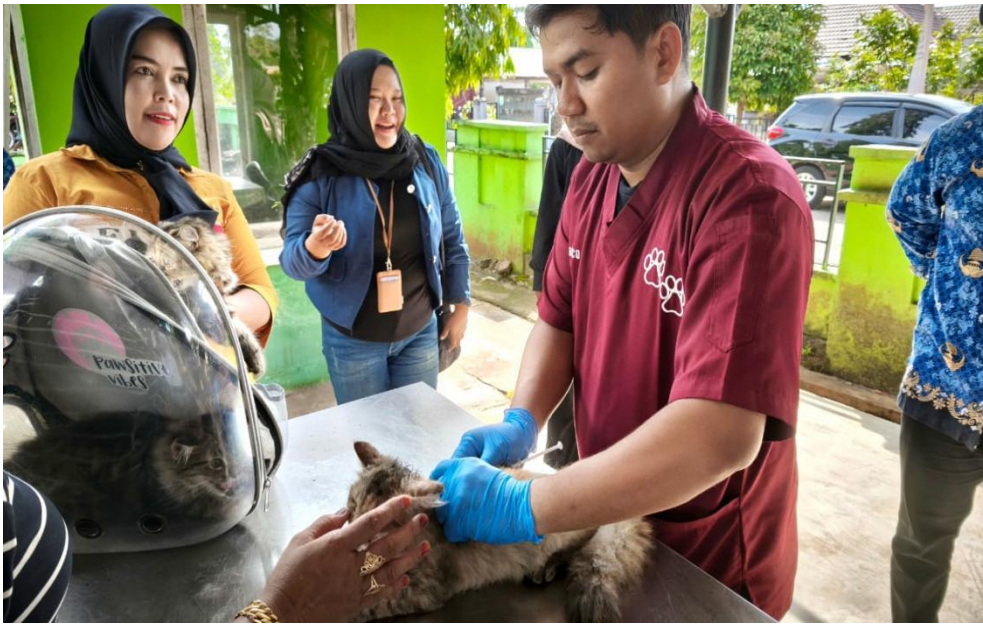
Gambar 4. Pelaksanaan Kegiatan Pelayanan Kesehatan Hewan di Kegiatan Bulan Bakti Peternakan Tahun 2025 di Dinas Pertanian dan Pangan Kab. Belitung Timur

Pada tahun 2025 Dinas Pertanian dan Pangan juga melakukan berbagai upaya dalam program inseminasi buatan (IB) sapi melalui penyediaan sarana prasarana nitrogen cair ( N_2 Cair), mensosialisasikan manfaat kawin suntik inseminasi buatan (IB), teknik perawatan ternak, dan memberikan pendampingan berkelanjutan kepada peternak.