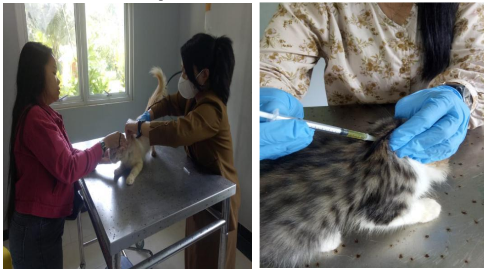
Gambar 3. Pelaksanaan Kegiatan Pelayanan Kesehatan Hewan di Pusat Kesehatan Hewan (Puskesmas) Desa Padang Kecamatan Manggar