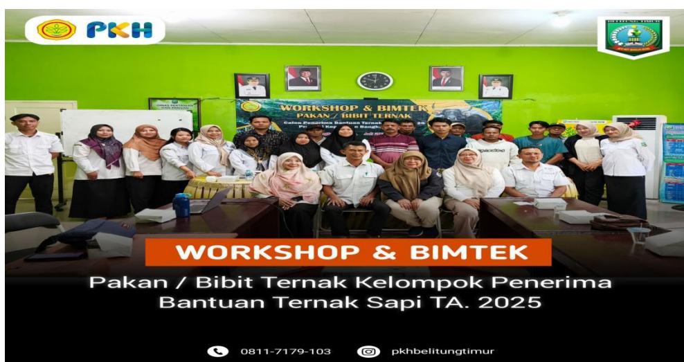
Gambar 13. Kegiatan Workshop dan Bimbingan Teknis Kelompok Ternak Penerima Bantuan Ternak Sapi Tahun 2025

Selain kegiatan Workshop dan Bimbingan Teknis, Dinas Pertanian dan Pangan Bidang Peternakan dan Kesehatan Hewan Kabupaten Belitung Timur menyelenggarakan pelatihan pengolahan pakan ternak dalam rangka meningkatkan pengetahuan dan keterampilan anggota kelompok tani dalam pengolahan pakan. Pembuatan pakan silase dan mineral blok diharapkan dapat meningkatkan produktivitas ternak serta efisiensi penggunaan sumber daya pakan.