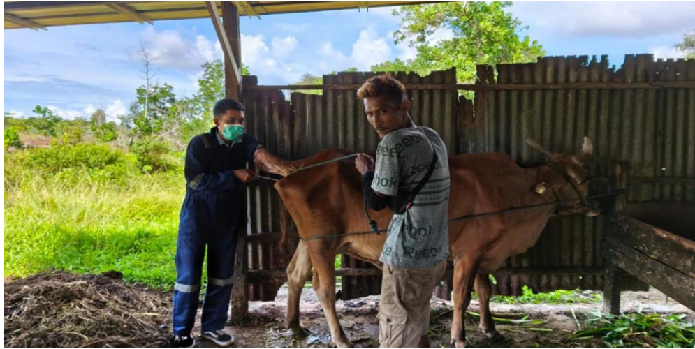
Gambar 6. Pelaksanaan Kegiatan Inseminasi Buatan (IB) pada Kelompok Ternak Sapi Di Kabupaten Belitang Timur

reproduksi sapi betina menggunakan alat khusus, seperti insemination gun , tanpa melalui perkawinan alami. Teknik ini bertujuan untuk meningkatkan kualitas genetik sapi, efisiensi produksi, dan mencegah penyakit menular kelamin.